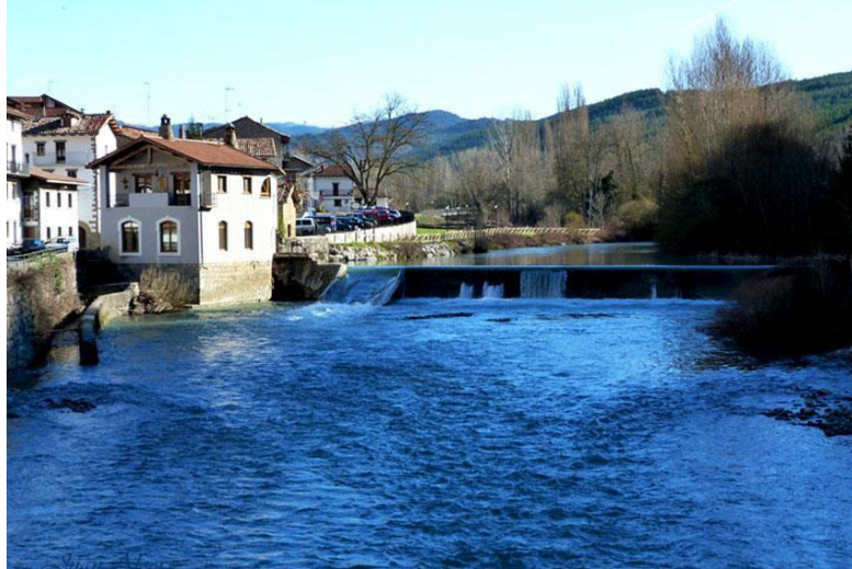
Mota: Ibaia | Kokapena: Burgin

Burgiko ibai igerilekua Batasuneko garrantzizko leku batean dago, almadien presatik ibaian behera. Ezka ibaia Pirinioetakoa eta bizia denez, legarrezko irlak edo barrak sortzen dira, eta urtero konfigurazio eta kokapen ezberdinak dituzte. Mendi heze eta karetsuko ibaia da. Ohantzean legar ertain eta handiak daude.